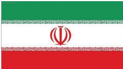
Vlajka Íránské islámské republiky

Exportní garanční a pojišťovací společnost, a.s. (EGAP) zahájila v srpnu projednávání nových obchodních případů do Íránu, a to ve fázi poradenství a předběžného posouzení. Podmínkou pro zahájení konečného posouzení nových obchodních případů pak bude odvolání sankcí znemožňujících vývoz do Íránu.