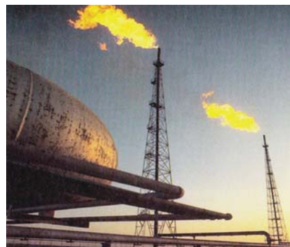
Írán vyrábí 60 až 70 % svých průmyslových zařízení na domácí půdě, včetně rafinerií, tankerů, těžebních věží, ropných plošin a výzkumných zařízení

V září roku 2014 se uskutečnila podnikatelská mise do Teheránu. Setkání bylo významné nejen z pohledu obchodního, ale i historického, neboť se jednalo o první podnikatelskou misi do Íránu. Podle sdělení Hospodářské komory ČR se do země vypravilo téměř 20 zástupců českých firem z oborů, jako je strojírenství, doprava či energetika. Pravděpodobně se tím podařilo opět nastartovat posílení tradičních íránsko-českých obchodních vztahů. Na konci dubna letošního roku pak na tuto cestu navázala