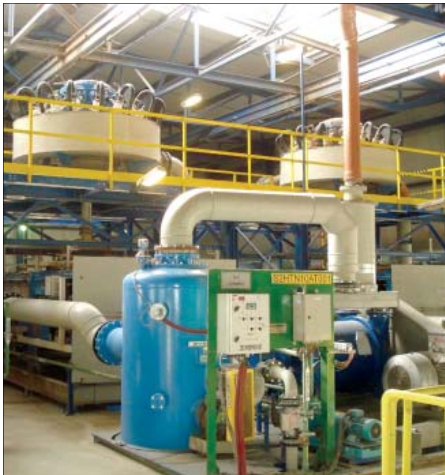
Odvodňovací linky energosádrovce v provozu

se na principu rozdílu hmotností pevných částic rozděljuje sádrovcová suspenze na dvě části. Část s podílem hrubších částic (44 % pevných částic) odtéká spodním výstupem na pásový filtr. Část s podílem jemnějších částic (z horního výstupu) se vrací do absorberu jako filtrát a obsahuje méně než 4,1 % hmotnosti pevných částic. Konečné odvodnění je navrženo tak, že se vytváří filtrační koláč s max. obsahem vlhkosti 15 % hm. Každá z linek EIMCO je schopna odvodnění 220 m 3 /hod.