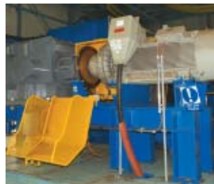
Pohon 300 kW

T1A, manipulační kladkostroje související s dopravníky linky „A“, přistoupilo se k přestavbě shazovacího vozu SV1 a mostového nakladače MN1 včetně instalace napájecích energořetězí. Od dubna 2009 je podstatná část zařízení rekonstruované linky A v režimu prozatímního užívání ke zkušebnímu provozu v souladu s vydaným rozhodnutím Stavebního úřadu Kadaň.