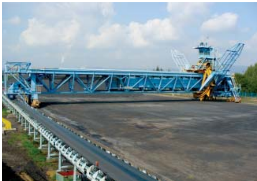
Mostový nakladač N2000x50

V rámci rekonstrukce byla na SV provedena revize ocelové konstrukce a výměna závěsných