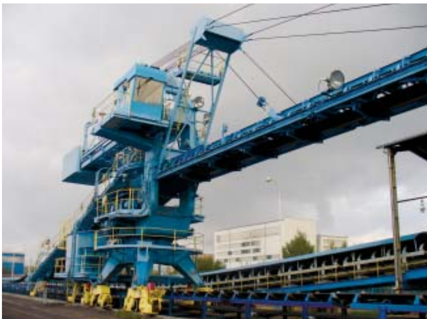
Shazovací vůz SVZ 2000/35